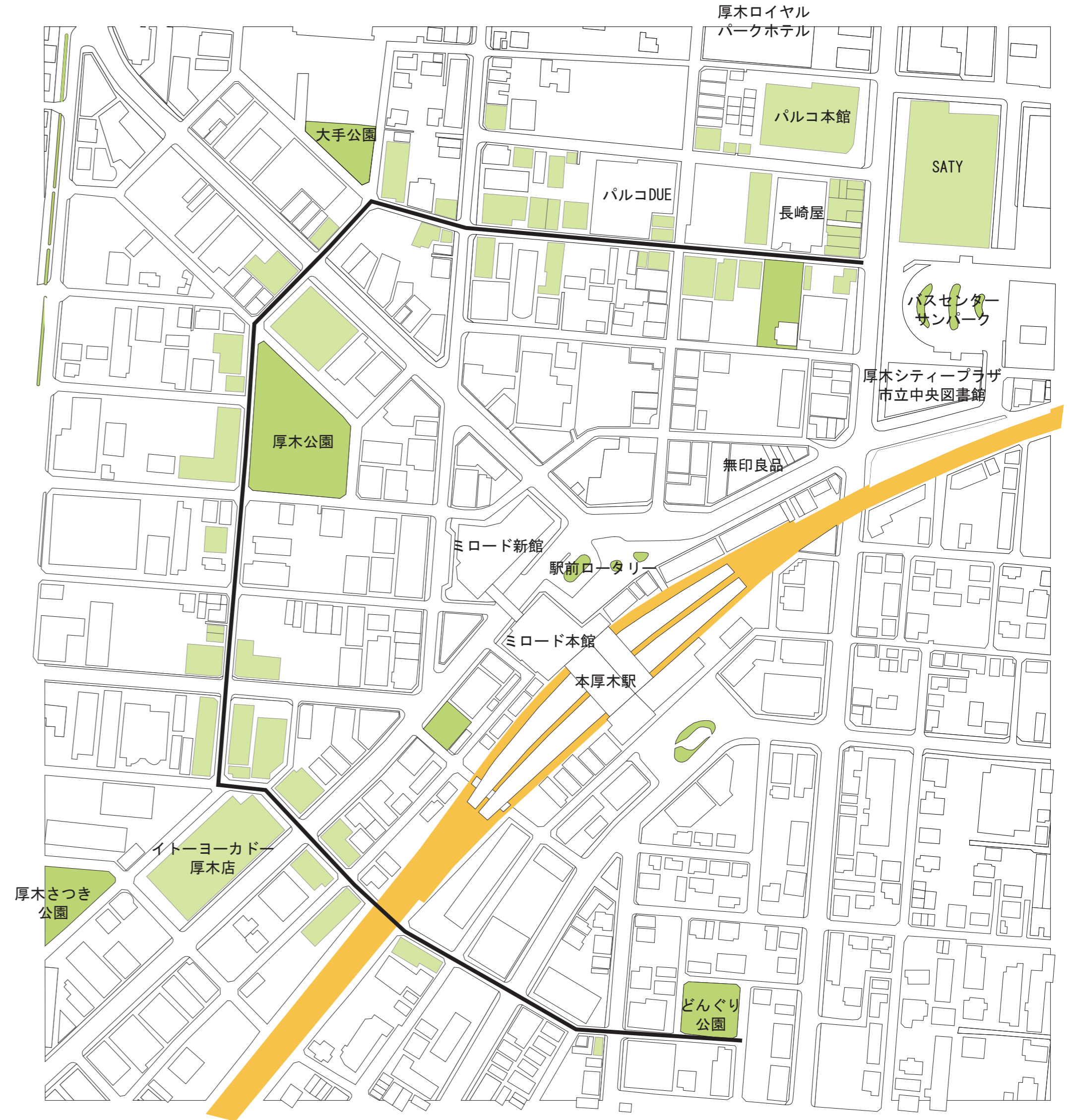
15時 営業中の店舗分布図