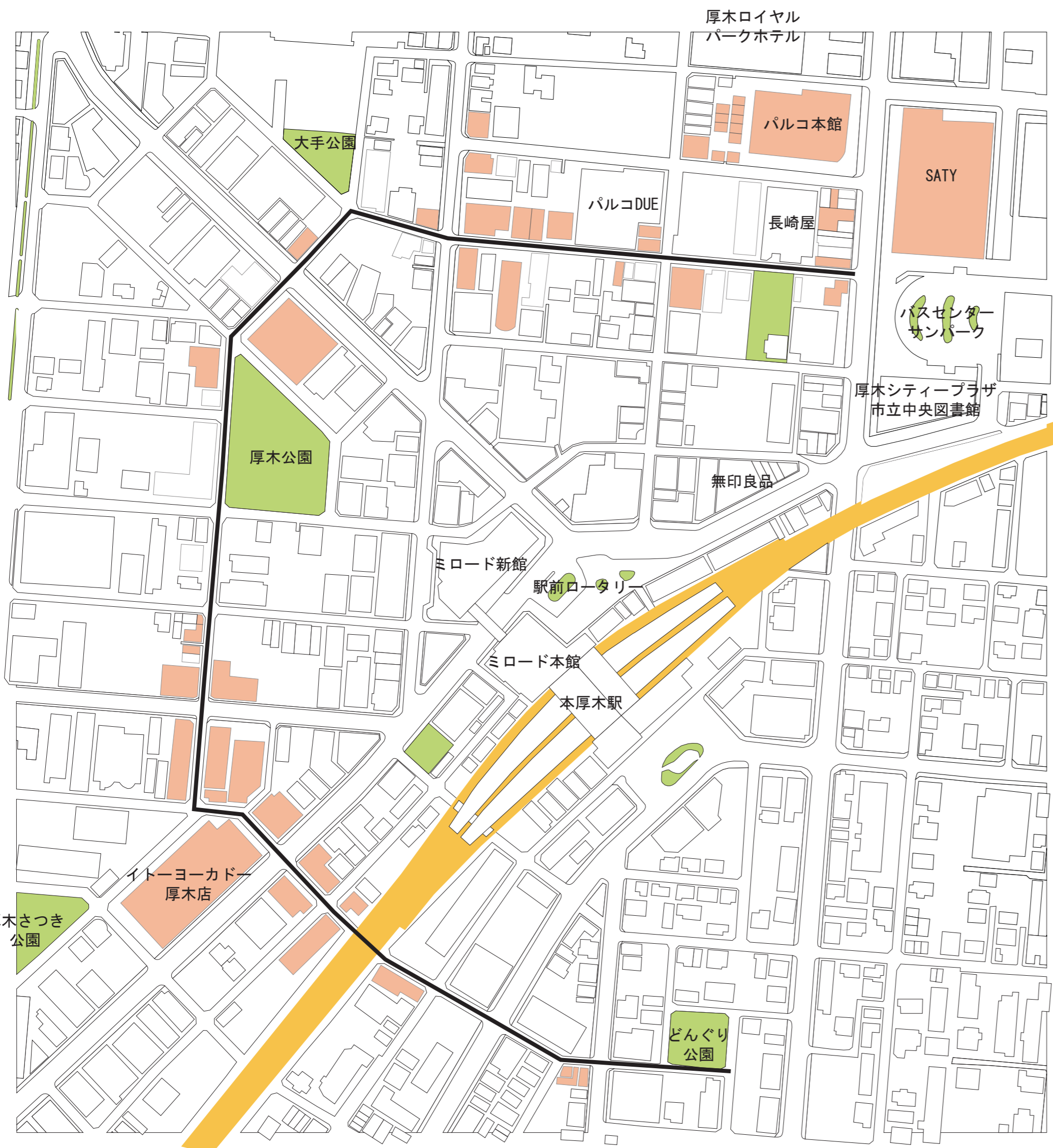
20時 営業中の店舗分布図