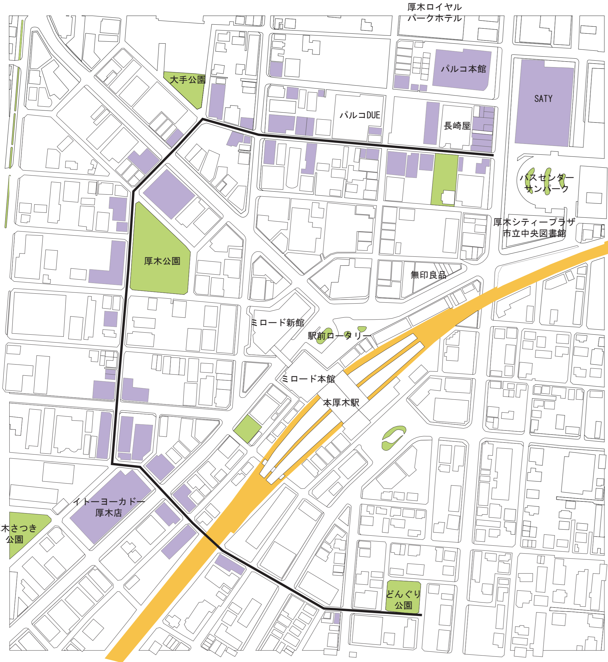
10時 営業中の店舗分布図

旧パルコDUEの前の通りは、飲食店と雑貨店が混在しているため、昼間は比較的明るい、夜間になるにつれて雰囲気は変化し、呼び込みなどする人達のため、近寄りやすい雰囲気を生み出している。